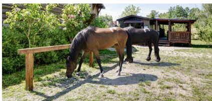
Stadnina koni Fundacja Stworzenia Pana Smolenia, Baranówko