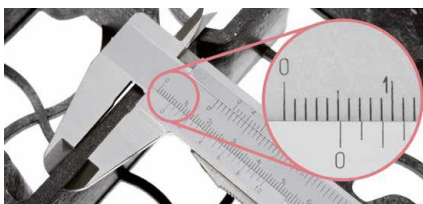
Bardzo wytrzymałe ścianki o grubości 5mm