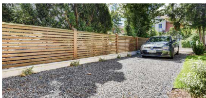
Miejsce postojowe w ogrodzie, Poznań